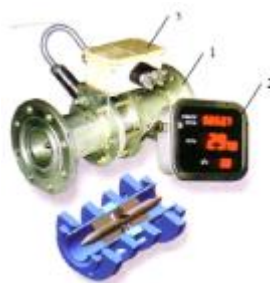
Рис. 5 - Турбінний лічильник рідини

Турбінні лічильники рідини (рис. 5) складаються з наступних функціональних блоків: первинного перетворювача турбінного (ППТ), в якому під дією потоку палива обертається турбіна, вторинний прилад, що відлічує число обертань турбіни за рахунок світлосигналів, сполучної коробки і кнопок управління, в тому числі скидання показань.