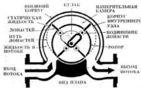
Рис. 3 - Принципова схема лопатевих лічильників рідини

яких спільно з підшипниками і кулаком утворюють жорстку систему, скріплену стрижнями.