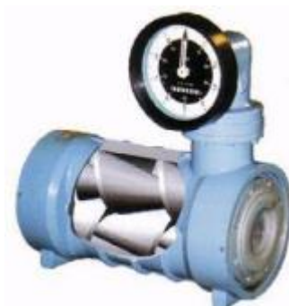
Рис. 4 - Гвинтовий лічильник рідини

об'єм. Обертання гвинтів через магнітну муфту подається в рахунковий механізм, перетворюючи в одиниці об'єму.