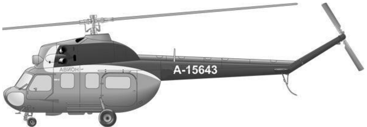
Рис.1. Загальний вид вертольота Мі-2

На вертольоті встановлені два газотурбінних двигуни ГТД-350 конструкції С. П. Ізотова. Злітна потужність кожного двигуна складає 400 л.с.