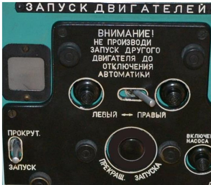
Рис.2 Щиток управління і контролю роботи системи пуску