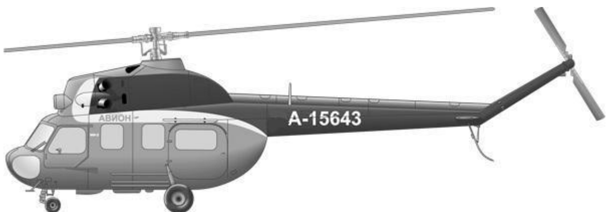
Рис.1. Загальний вид вертольота Мі-2

На вертольоті встановлені два газотурбінних двигуни ГТД-350 конструкції С. П. Ізотова. Злітна потужність кожного двигуна складає 400 л.с.