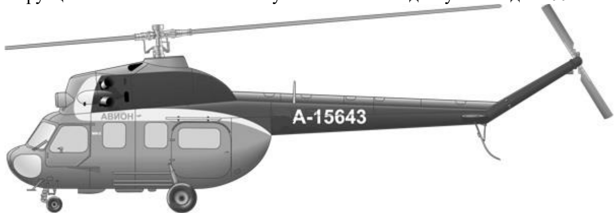
Мал.1. Загальний вид вертольота Мі-2

На вертольоті встановлені два газотурбінних двигуни ГТД-350 конструкції С. П. Ізотова. Злітна потужність кожного двигуна складає 400 л.с.