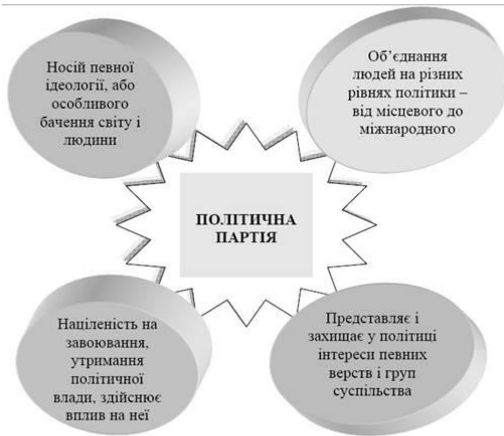
Рис.1 Сутність політичної партії

СУТНІСТЬ ПОЛІТИЧНОЇ ПАРТІЇ – відображена на рис.