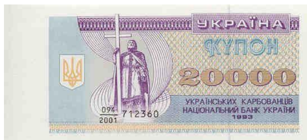
Купоно-карбованці зразка 1993 р.