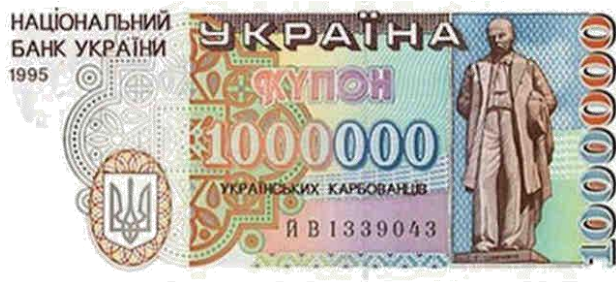
Купоно-карбованці зразка 1995 р.

Купони багаторазового використання тимчасово замінили в обігу законні засоби платежу. Хоча їх планувалося ввести лише на 4-6 місяців, вони проіснували до 1996 р.