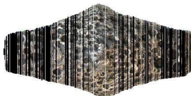
Київська гривня, 11-13 ст.

1. В Київській Русі з XI ст. й до першої хвилі монголо-татарського нашествия у 1237–1241 рр. в обігу були київські гривні шестикутної форми, які мали вигляд витягнутого ромба з усіченими кінцями, вагою близько 140–160 г, що служили одиницею платежу та засобом накопичення.