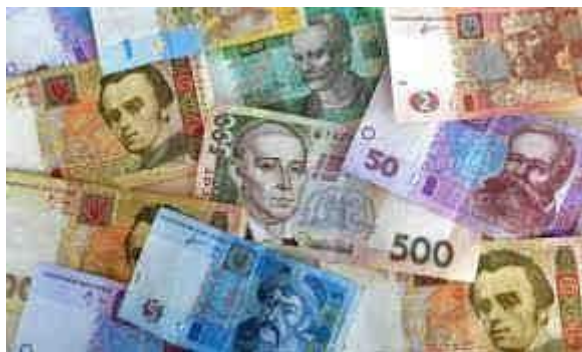
Сучасні українські гроші

Сьогодні НБУ випускає гривні – паперові знаки та монети – з історичною українською символікою, ведучи своєрідний літопис нашої країни з прадавніх часів до сьогодення.