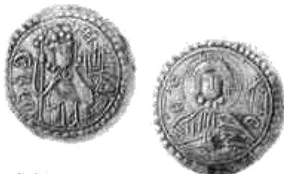
Срібляник князя Володимира

Спочатку вони копіювали дизайн візантійських монет – солідів: на лицьовій стороні було зображено князя, що сидить на престолі, а на зворотному – Пантократора, тобто Ісуса Христа.