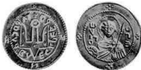
Срібляник Ярослава Мудрого

Ярослав Мудрий срібні монети карбував під час князювання у Новгороді (до 1015 р.). На лицьовому боці вміщено зображення святого та напис «Святий Георгій» (християнське ім'я Ярослава було Георгій), на зворотному – родовий знак – тризуб – з написом «Ярославле сребро». Проте, посівши великокняжий престол в Києві у 1019 р., Ярослав припинив карбування монет, затверджуючи суверенітет держави через вдалу зовнішню та внутрішню політику.