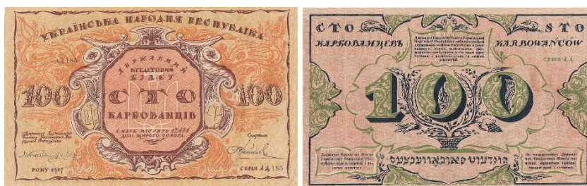
100 карбованців УНР

Але вже наступного року після проголошення УНР «самостійною, ні від кого незалежною державою», Центральна Рада прийняла закон про запровадження нової грошової одиниці – гривні, яка поділялася на 100 шагів і дорівнювала 1/2 карбованця.