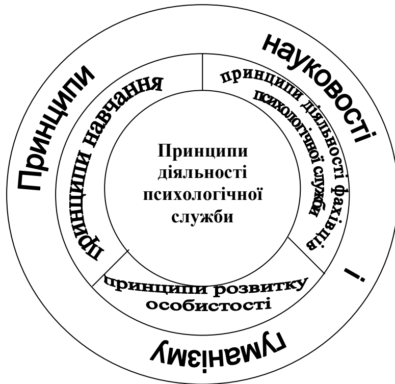
Мал.2. Система принципів діяльності психологічної служби.