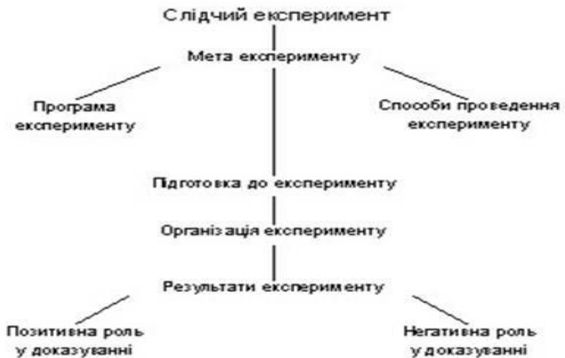
Рис. 12. Структура слідчого експерименту.

Слідчий експеримент із погляду його пізнавальної ролі у процесі розслідування структурно подано на рис. № 1.