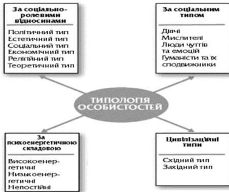
Схема 3. Типологія особистостей

Важливим питанням для розуміння проблеми особистості є питання про типологію особистостей. Існує ціла низка типологій, що беруть за основу певний критерій, серед яких: налаштованість особистості на соціальні ролі, соціальні фактори, психоенергетичні якості особистості, цивілізаційні особливості суспільства і ряд інших. (схема 3).