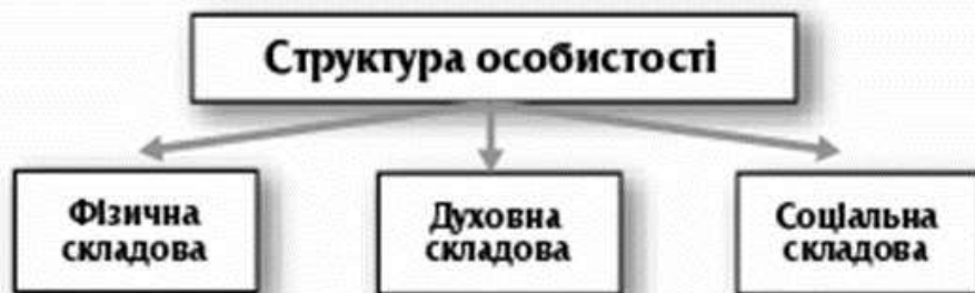
Схема 2. Структура особистості

Таке розуміння особистості свідчить про складну внутрішню структуру цього феномена, що має в собі фізичну, соціальну і духовну складові (схема 2).