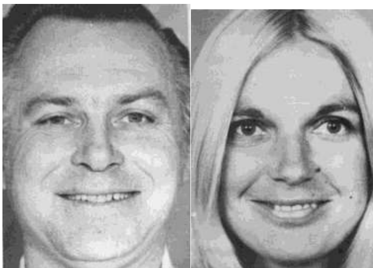
Рис. 5.16. Повна експресія радості

На рис. 5.16 представлена міміка радості помірної інтенсивності.