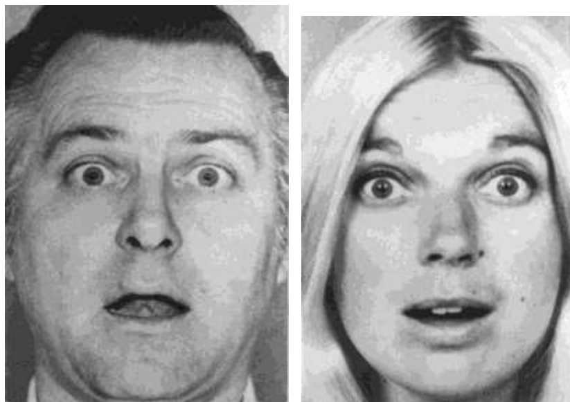
Рис. 5.8. Повна експресія здивування

Міміку здивування легко імітувати, але ознакою фальсифікації здивування може бути її тривалість: міміка щирого здивування утримується на обличчі менше секунди. Якщо вираз здивування триває довше, це ознака удаваного здивування. Якщо ознаки здивування представлені лише у верхній частині обличчя (зоні «чоло-брови») на фоні спокійного стану двох інших зон, то такий вираз - «емблема» здивування (коли мімічний вираз використовується в якості символічного позначення переживання, у даному випадку цей вираз символізує сумнів або питання). Якщо цей вираз триває кілька секунд, він може бути «розмовним підсилювачем».