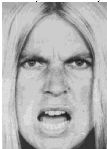
Рис. 5.5. Повна експресія гніву (комбіноване фото)

На рис. 5.5 представлений варіант міміки гніву з відкритим ротом (гнів, який виражається у словах або у крику).