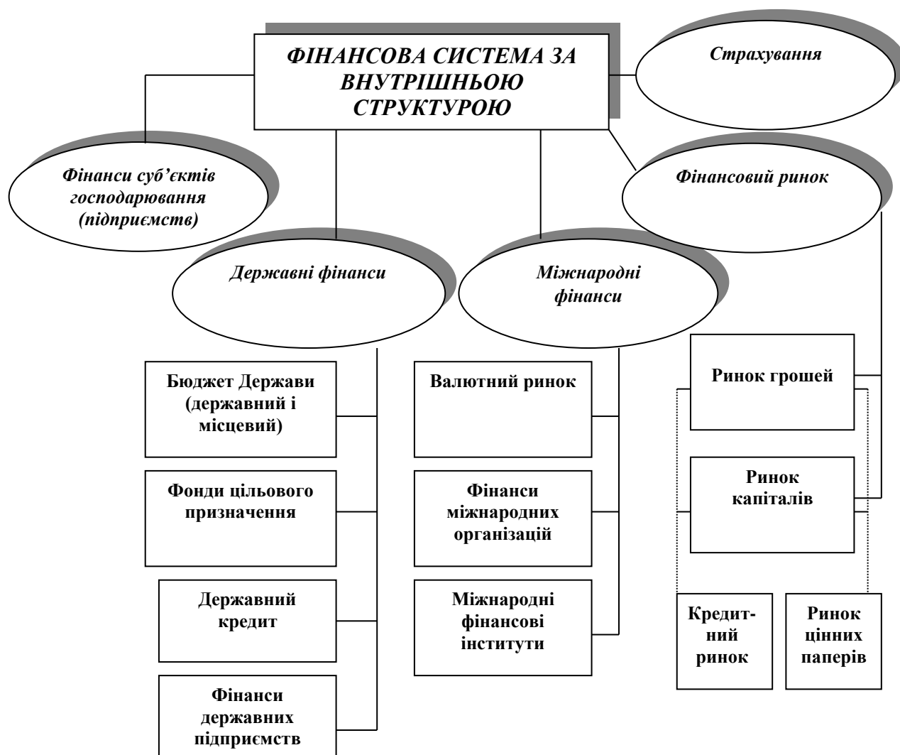
Рисунок 1 – Фінансова система України за внутрішньою структурою

Внутрішня структура фінансової системи відображає об'єктивну сукупність фінансових відносин і є загальною для всіх країн. Вона складається зі сфер і ланок. Сфера характеризує узагальнену за певною ознакою сукупність фінансових відносин, а ланки – їх відособлену частину (див. рис. 1).