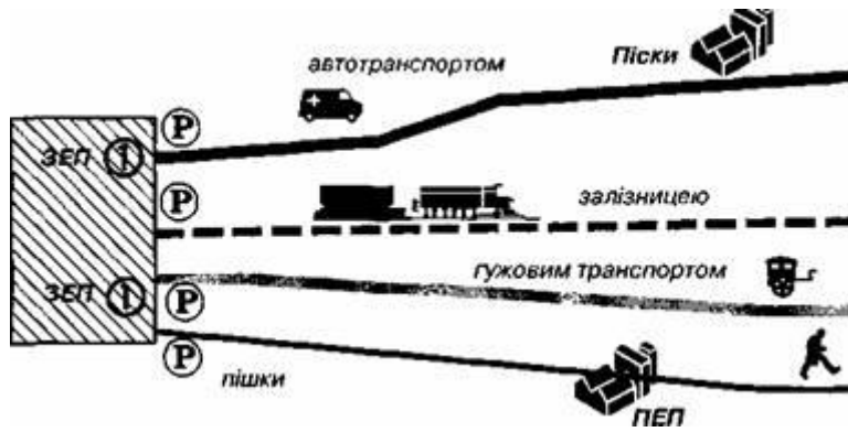
Рис. 6.1. Схема евакуації

У заміській зоні робітників і службовців розміщують зі своїми сім'ями, а на роботу відправляють у місто.