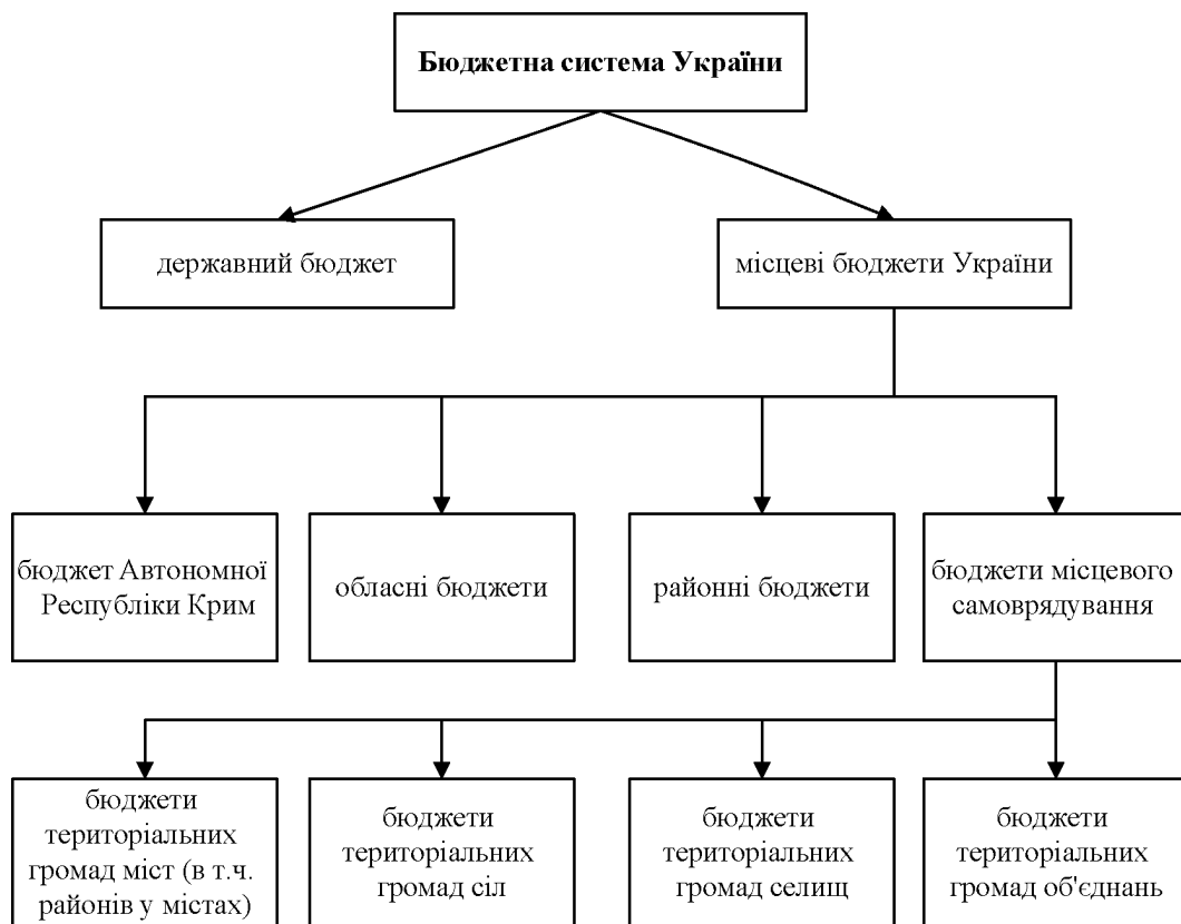
Рис. 2. Структура бюджетної системи України

Взаємозв'язок між усіма ланками бюджетної системи забезпечується за допомогою зведених бюджетів. Зведений бюджет – це сукупність показників бюджетів, що використовуються для аналізу та прогнозування економічного і соціального розвитку держави. Сукупність всіх бюджетів, що входять до складу бюджетної системи України, є зведеним бюджетом України .