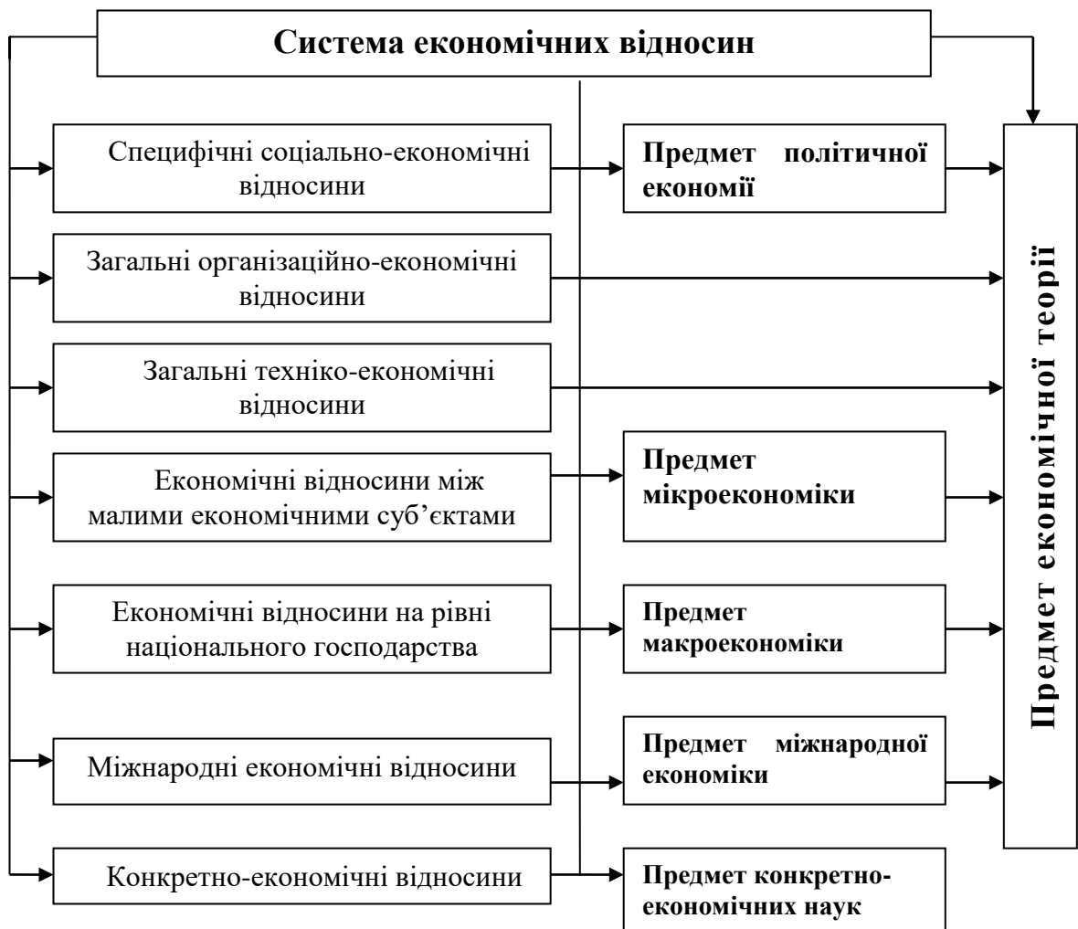
Рис. 1.1. Економічні відносини як цілісна економічна система та предмет економічної теорії