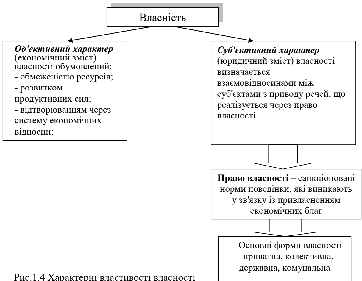
Рис.1.4 Характерні властивості власності

Система економічних відносин власності виявляється у всіх фазах кругообігу (виробництва, розподілу, обміну і споживання) і включає такі елементи: а) привласнення факторів і результатів виробництва; б) господарське використання майна; в) економічні форми реалізації власності.