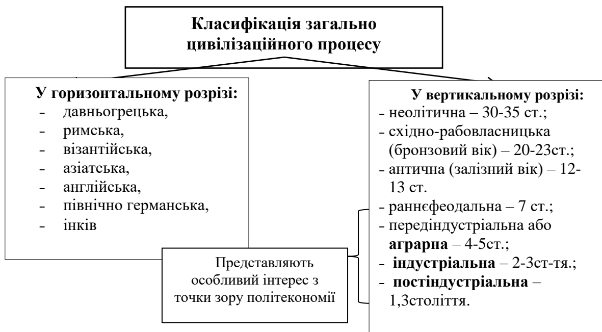
Рис. 1.3 – Класифікація загально цивілізаційного процесу

Л. Морган і Ф. Енгельс це поняття використовували для характеристики стадій розвитку людського суспільства. У постсоціалістичних країнах його використовують для визначення ефективно організованого ладу, системи соціально-економічних відносин в індустріально розвинутих країнах світу.