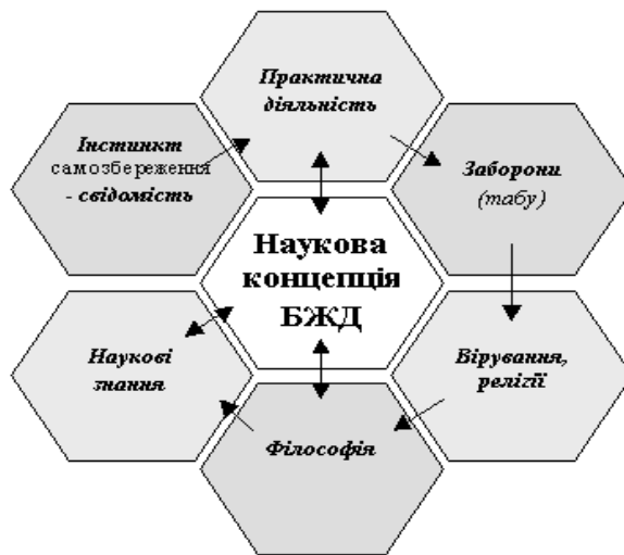
Рис. 2 Наукова концепція БЖД