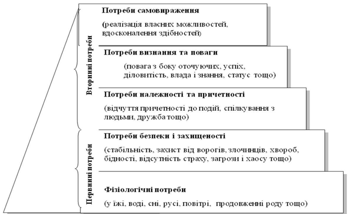
Рис.1 Ієрархія потреб Абрахама Маслоу

Потреби безпеки і захищеності відображають біологічну сутність людини і визначають її поведінку, мотиви діяльності. Намагаючись зберегти власне життя, чи життя рідних, коли їм загрожує небезпека, людина може віддати усе майно; психологічний вплив на людину шахраїв зазвичай теж спирається на бажання захистити близьких від небезпек і на страху; чи на рівні держави, для захисту громадян країни від хвороб впроваджують вакцинацію; людина влаштовується на роботу намагаючись забезпечити себе і родину житлом, їжею (захист від безробіття).