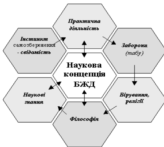
Рис. 2 Наукова концепція БЖД

Основні теоретичні положення безпеки життєдіяльності: