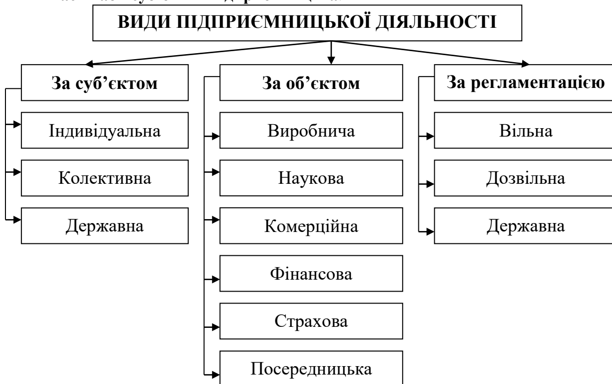
Рис. 5.4. Види підприємницької діяльності

Індивідуальне підприємництво. Суб'єктами підприємництва (підприємцями) можуть бути приватні особи (громадяни або фізичні особи – окремі індивідууми та їх сім'ї), які виступають організаторами одноосібної економічної діяльності із застосуванням власних засобів виробництва і праці (торгівельні крамниці, аптеки, хімічистки) та невеликого (капіталістичного) виробництва на основі капіталу і найманої праці.