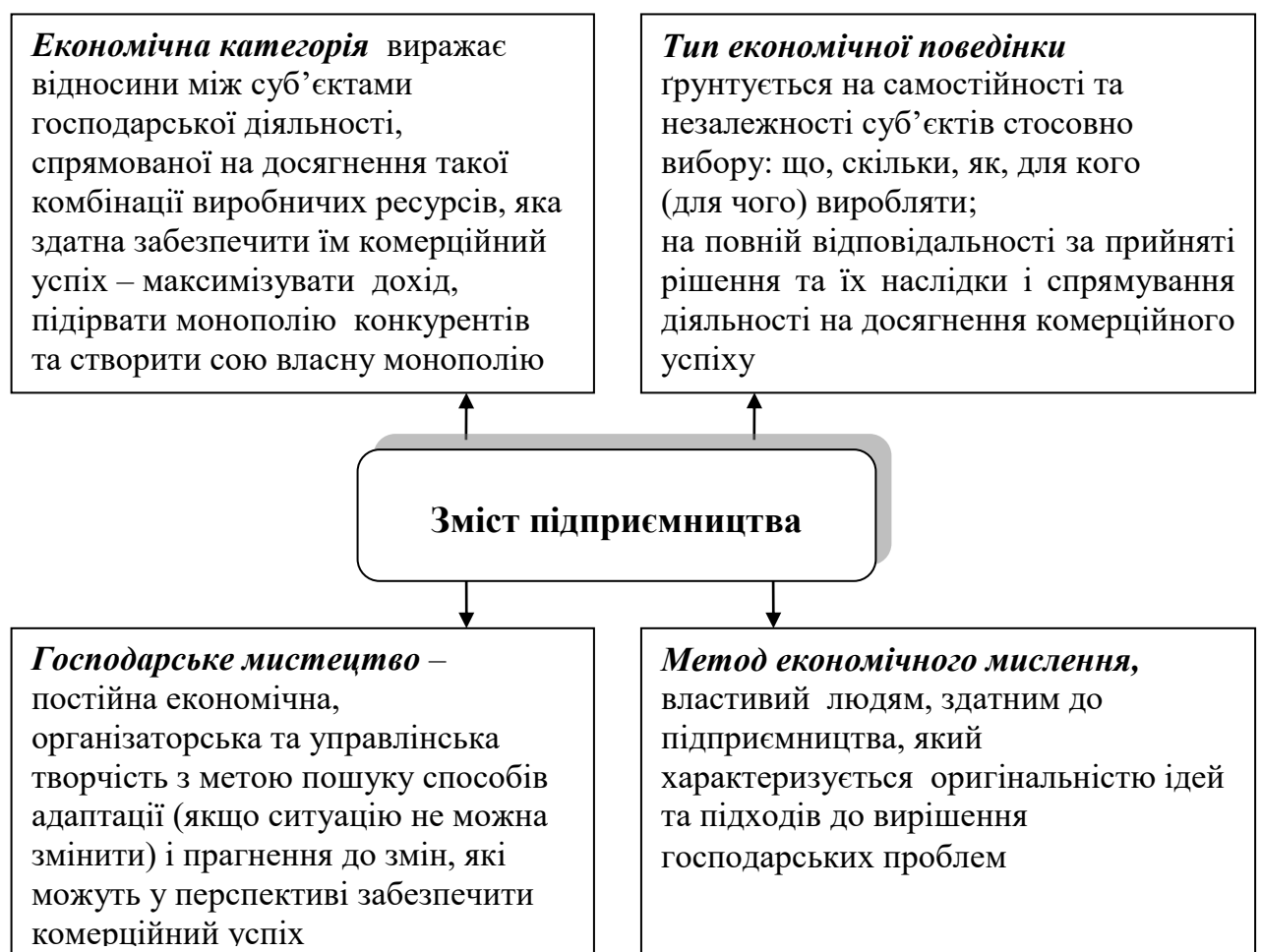
Рис. 8.1. Визначення змісту підприємництва

Сутність і функції підприємництва. Сутнісне поняття „підприємництва” надзвичайно містке й різноаспектне. Це зумовлено тим, що в ньому переплітається сукупність економічних, юридичних, політичних, історичних і психологічних відносин . Уявлення про нього складалося впродовж значного історичного часу, змінювалось під впливом базисних та надбудовних інституцій, психології людей. В економічній теорії зміст підприємництва визначається як: економічна категорія, тип економічної поведінки, господарське мистецтво та метод економічного мислення (рис. 8.1).