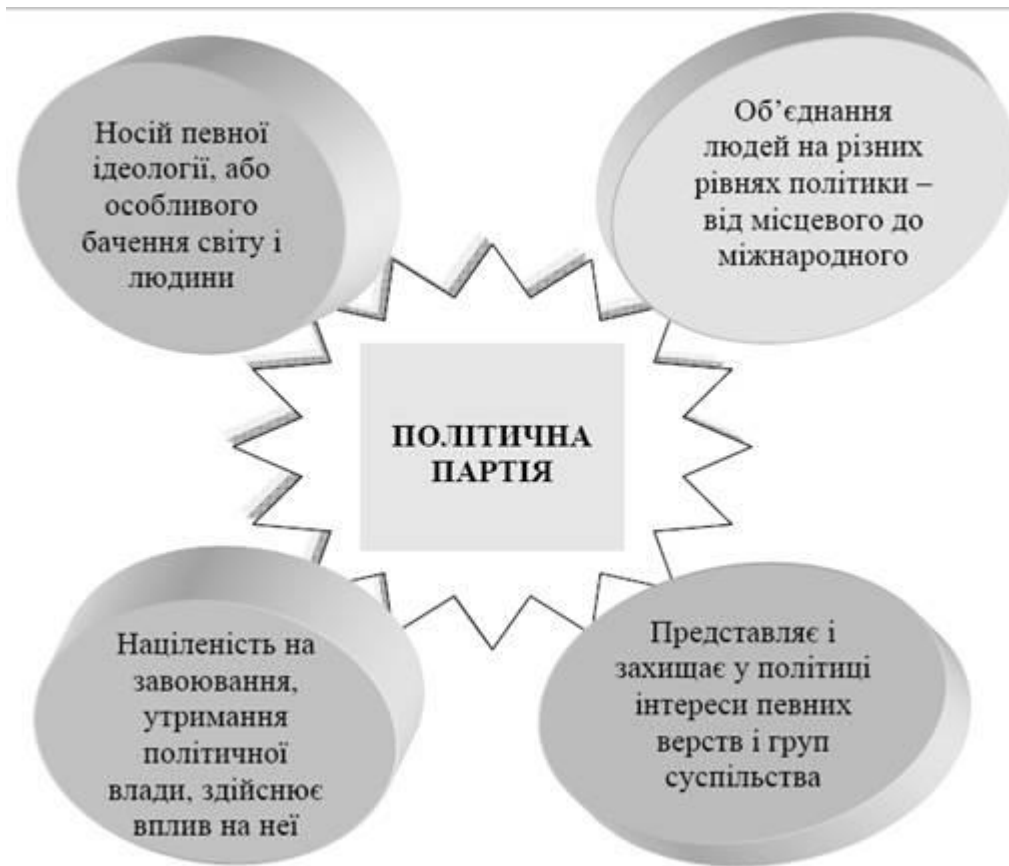
Рис.1 Сутність політичної партії

ФУНКЦІЇ ПОЛІТИЧНОЇ ПАРТІЇ – політична партія є специфічним інститутом політичної системи, а тому її функції носять тільки політичний характер.