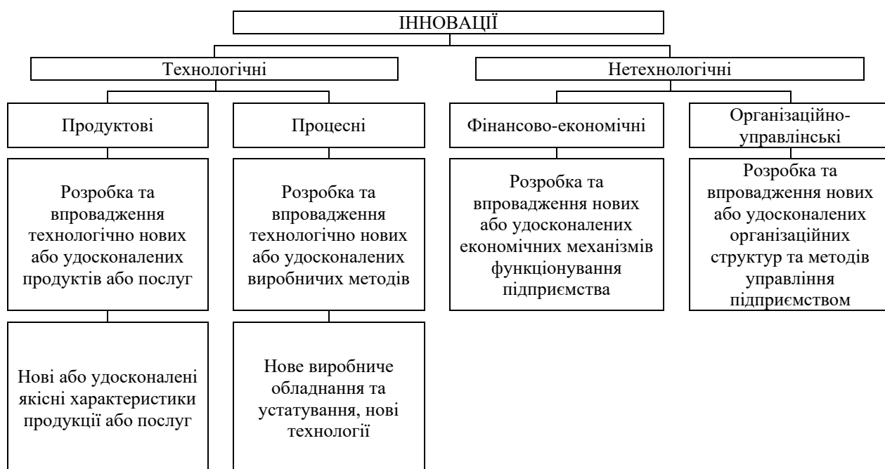
Рис. 1.1.1 Структура основних типів інновацій авіакомпаній[76, с. 192]