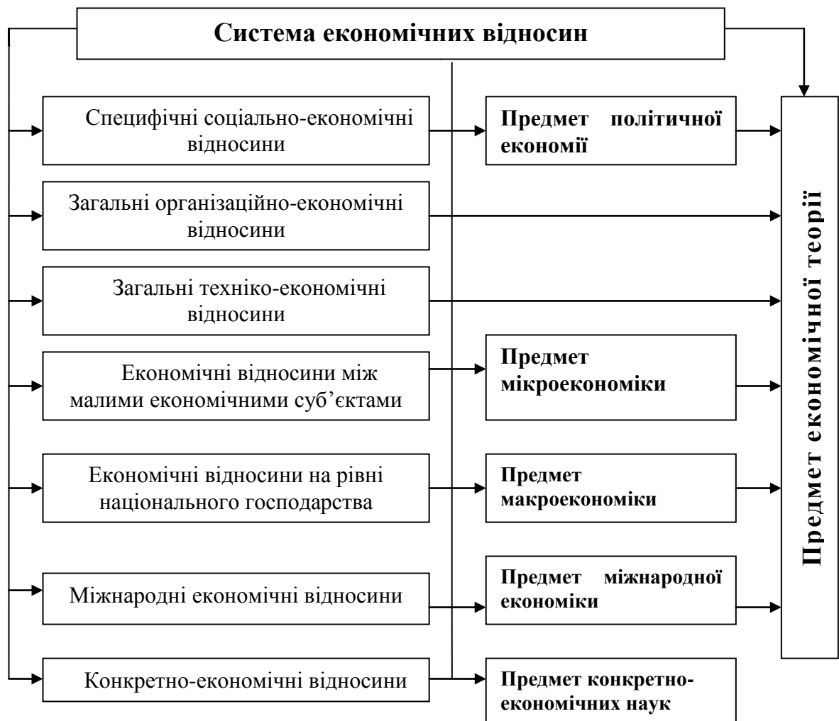
Рис. 1.1. Економічні відносини як цілісна економічна система та предмет економічної теорії