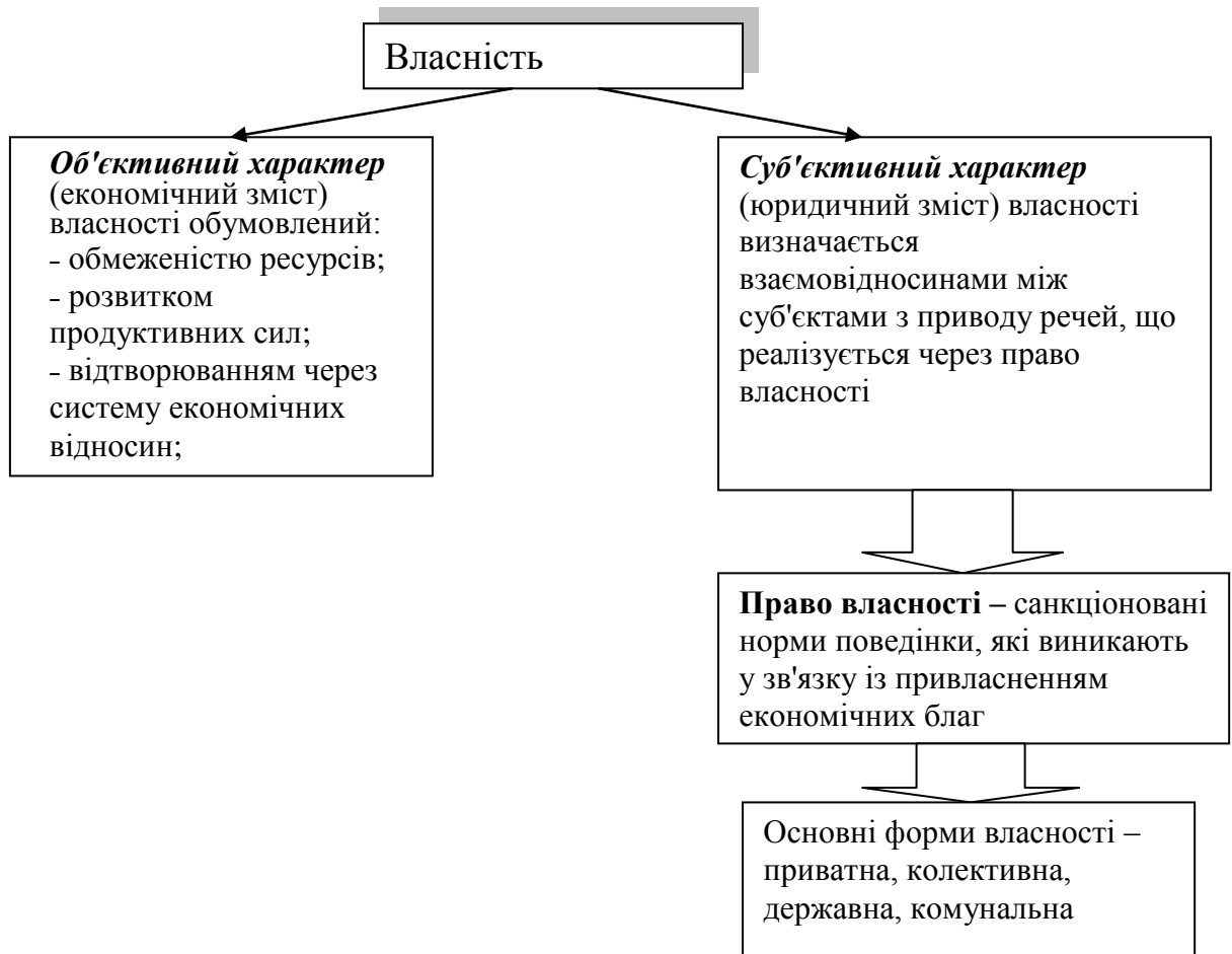
Рис.1.4 Характерні властивості власності

Власність в економічному значенні – це економічні відносини між людьми по привласненню і господарському використанню матеріальних і духовних благ.