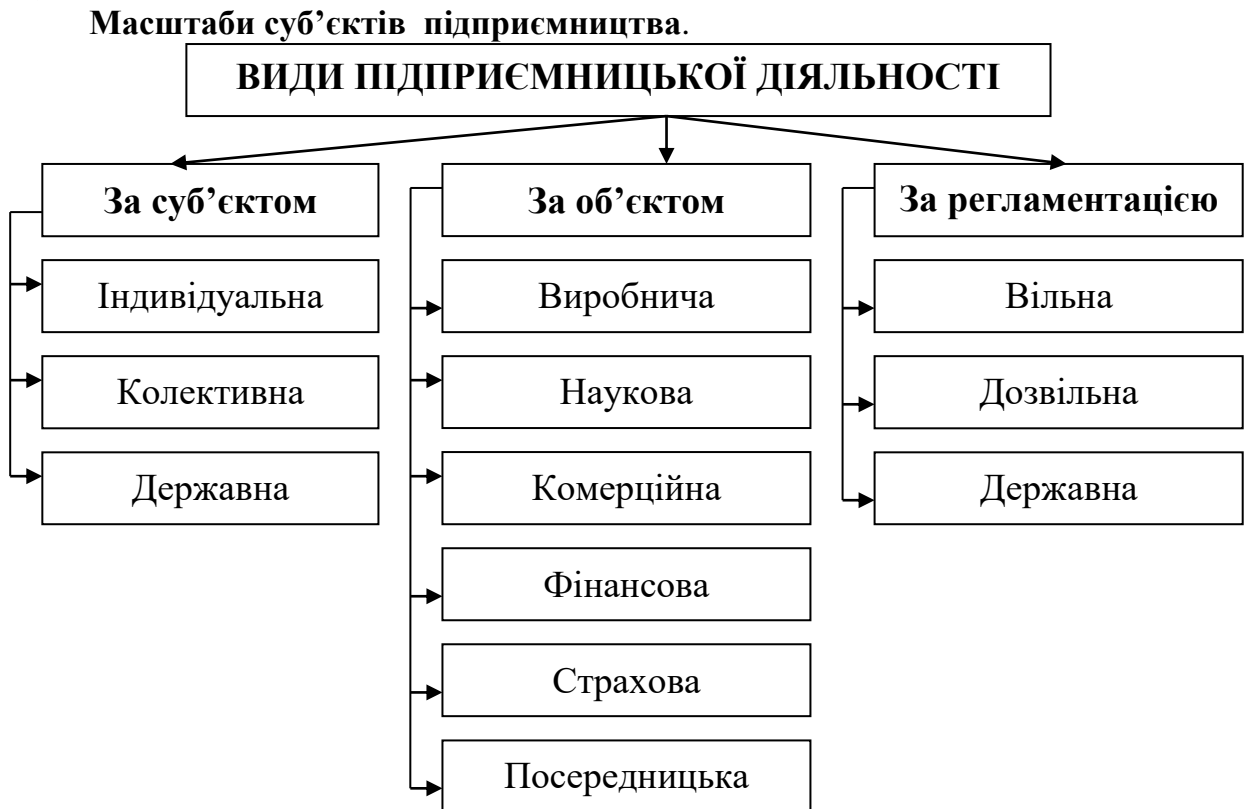
Рис. 5.4. Види підприємницької діяльності

Види підприємництва класифікуються за трьома основними ознаками: масштабами суб'єктів, характером об'єктів та регламентацією підприємницької діяльності (рис. 5.4).