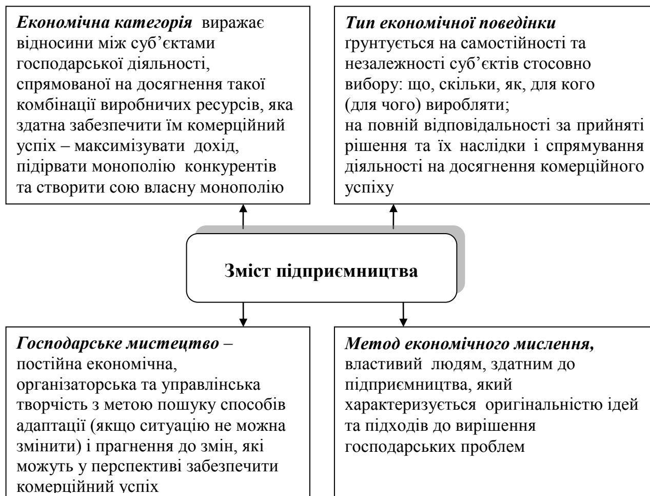
Рис. 8.1. Визначення змісту підприємництва

Сутність і функції підприємництва. Сутнісне поняття „підприємництва” надзвичайно містке й різноаспектне. Це зумовлено тим, що в ньому переплітається сукупність економічних, юридичних, політичних, історичних і психологічних відносин . Уявлення про нього складалося впродовж значного історичного часу, змінювалось під впливом базисних та надбудовних інституцій, психології людей. В економічній теорії зміст підприємництва визначається як: економічна категорія, тип економічної поведінки, господарське мистецтво та метод економічного мислення (рис. 8.1).