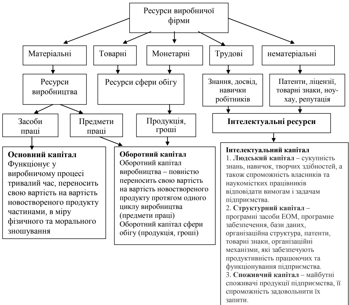
Рис. 8.6. Ресурси виробничої фірми

Капітал фірми – це сукупність ресурсів фірми у вартісному вимірі, що забезпечують створення нової вартості.