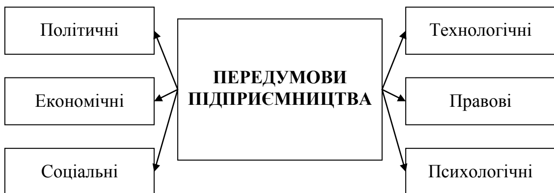
Рис. 5.3. Передумови підприємництва

Практична реалізація принципів функціонування підприємництва здійснюється у певному соціально-економічному середовищі, що охоплює політичні, економічні, соціальні, технологічні, правові й психологічні передумови (рис.5.3).