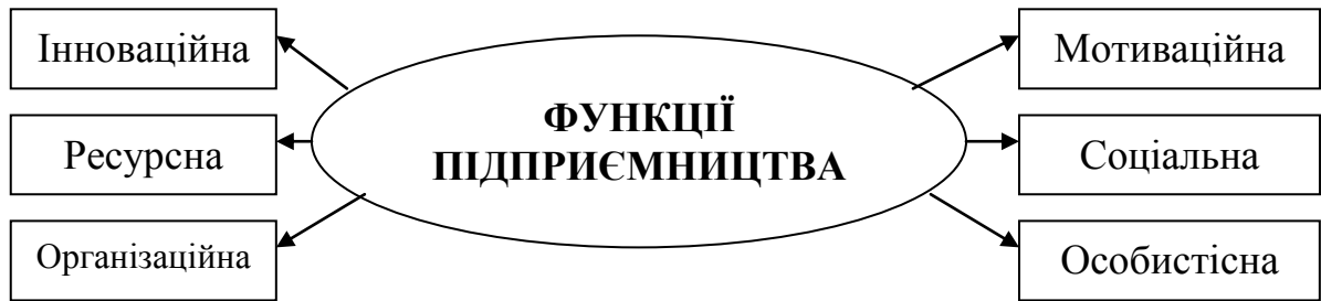
Рис. 5.2. Функції підприємництва

Інноваційна функція полягає у пошуку та генеруванні й реалізації новаторських ідей, здійсненні експериментальних техніко-економічних, наукових, дослідно-конструкторських розробок, творчих проєктів, що пов'язані з господарським ризиком. Саме ця функція спонукає справжнього підприємця використовувати переважну частину своїх доходів на здійснення новаторської підприємницької діяльності, а не на задоволення власних споживчих потреб.