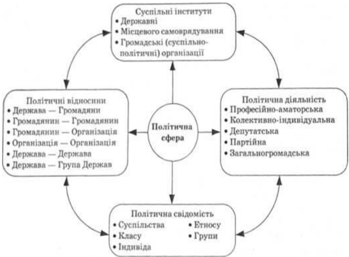
Рис. 1.7. Політична сфера

Політичні відносини відображають стійкий характер взаємодії суб'єктів між собою в процесі досягнення і здійснення політичної влади (компроміси, угоди, вчинки, розрахунки тощо). У політиці наявна підтримка політичних відносин у суспільстві однією частиною населення і нейтральність чи невдоволення іншої частини. Тому політикою є не стільки функціонування державного апарату як такого, як вирішення ним конкретних суспільних проблем у тій чи іншій формі: через нормотворчість, діяльність щодо підтримання або зміни актуальних політичних відносин, прийняття рішень для досягнення згоди.