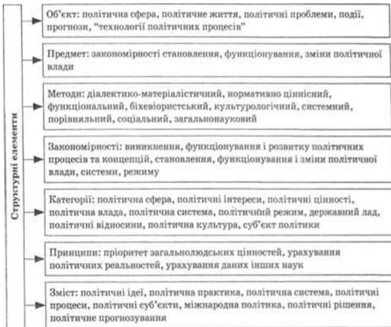
Рис. 1.3. Схема об'єкта, предмета й структури політології

породжують проблему, проблемну ситуацію, то предмет – це певний аспект дослідження відносин, процесу чи явища в межах обраного об'єкта (рис. 1.3).