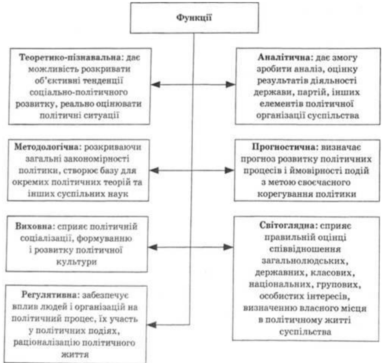
Рис. 1.4. Функції політології

демократично-правові ідеї епохи Ренесансу та Просвітництва: народного суверенітету, верховенства закону, виборності органів влади. Це засвідчено, зокрема, у монографіях, енциклопедичних довідниках, підручниках, які свого часу побачили світ у цих країнах. А упродовж останнього півстоліття політична наука визначається як окрема наукова і навчальна дисципліна, яка поширює свій вплив і популярність в усьому світі.