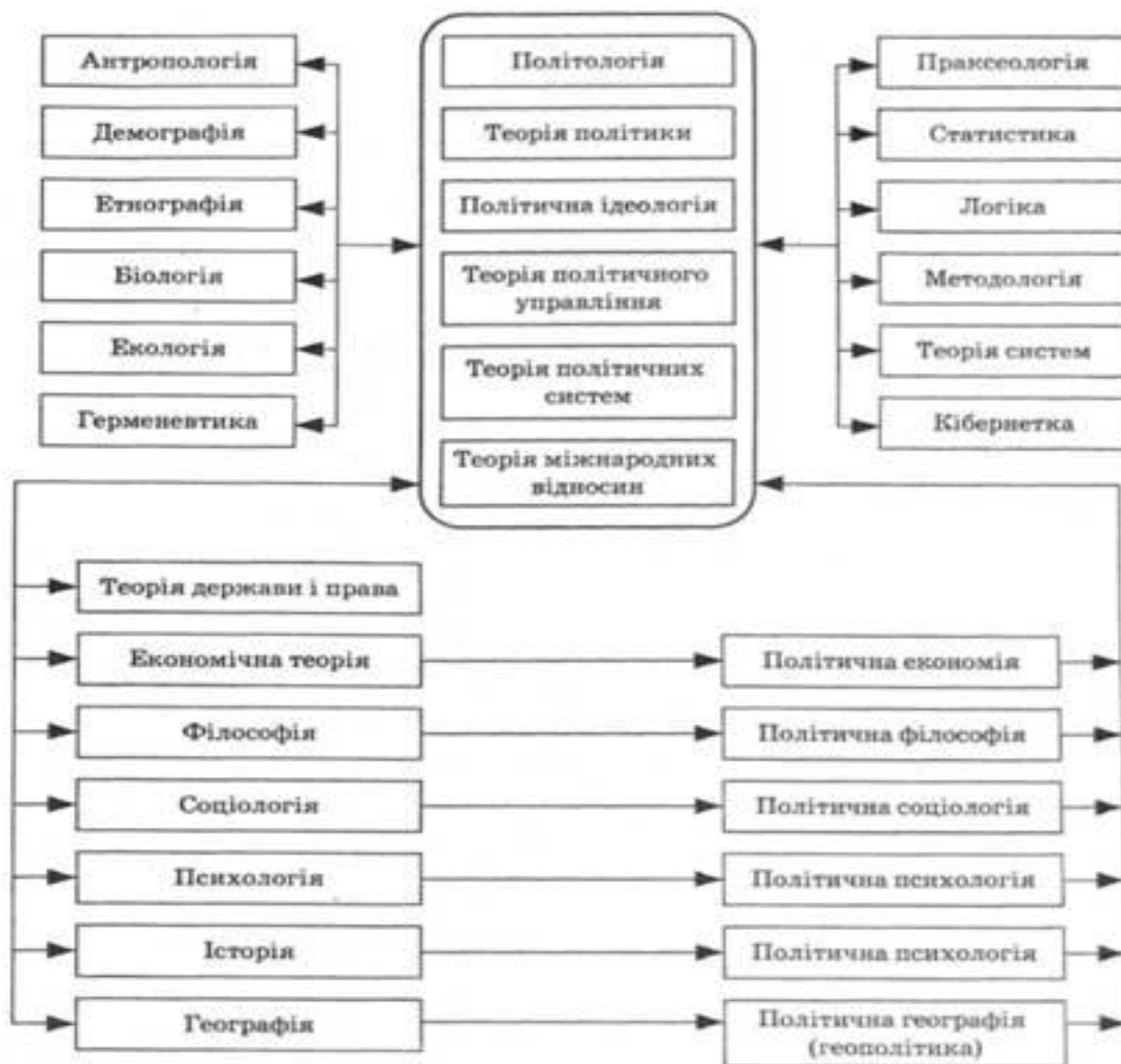
Рис. 1.1. Схема дисциплін, в центрі яких перебуває політика

Як окрема наука, політологія виникає 1948 р. Перший досвід самостійного існування підвела Міжнародна асоціація політичної науки, коли 1955 р. фахівці зі США, Великобританії, Франції, Швеції, Індії, Мексики, Польщі, Єгипту, Канади, Німеччини, Греції та Югославії підготували і випустили дослідження "Суспільні науки у вищій школі. Політична наука". Спільною працею учених у рамках проекту ЮНЕСКО обґрунтовано деякі висновки принципового значення.