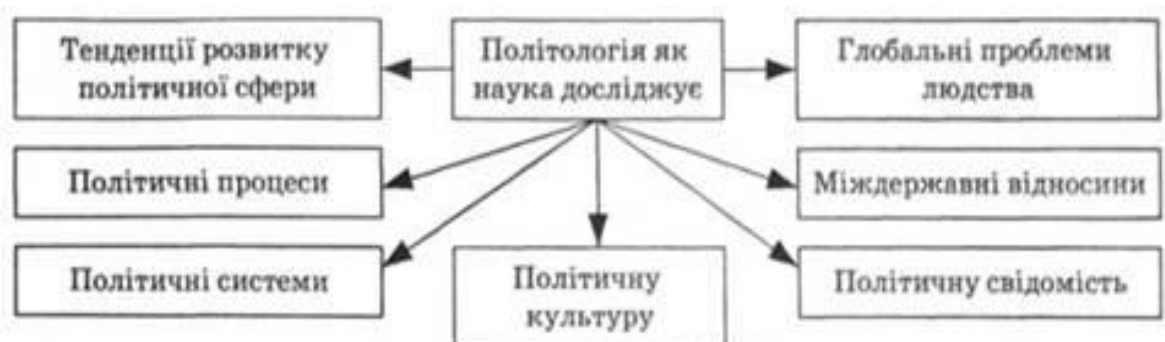
Рис. 1.2. Схема розвитку політичної сфери

З плином часу вимоги до молодшої науки зростають, професійні інтереси науковців, утілювані національними школами, урізноманітнюються. Кількість напрямків дослідження в контексті політології збільшується, досягаючи, зокрема, у Франції десяти, в Україні їх — п'ять (рис. 1.2).