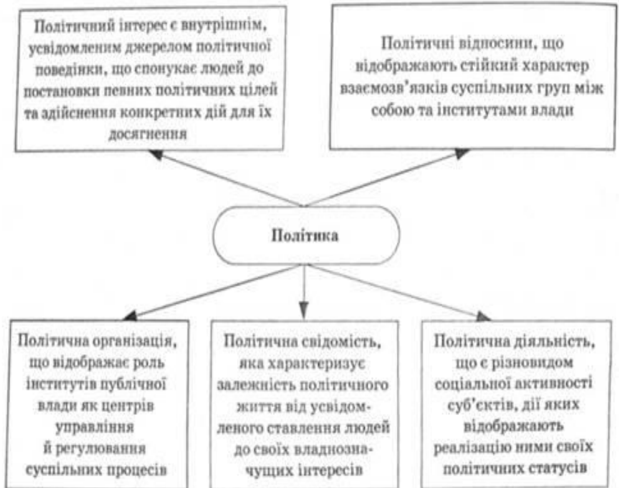
Рис. 1.6. Розгалуження політики на політичні інтереси, відносини, організацію, свідомість, діяльність

Політична практика змушує вирішувати значно складніші завдання. Людину в політиці не завжди можна оцінити за релігійною чи побутовою мораллю: вона не завжди діє у цій сфері людських відносин, де на перше місце історія висуває закон, інтереси держави, народу, єдність суспільства, безпеку надії.