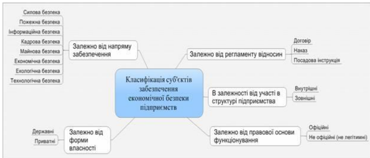
Рисунок 5.1 - Класифікація суб'єктів забезпечення економічної безпеки підприємств

Суб'єктами економічної безпеки виступають держава та її інститути (міністерства, відомства, податкові й митні органи, біржі, фонди і страхові компанії), а також підприємства, установи й організації як державного, так і приватного сектора економіки (рис. 5.1).