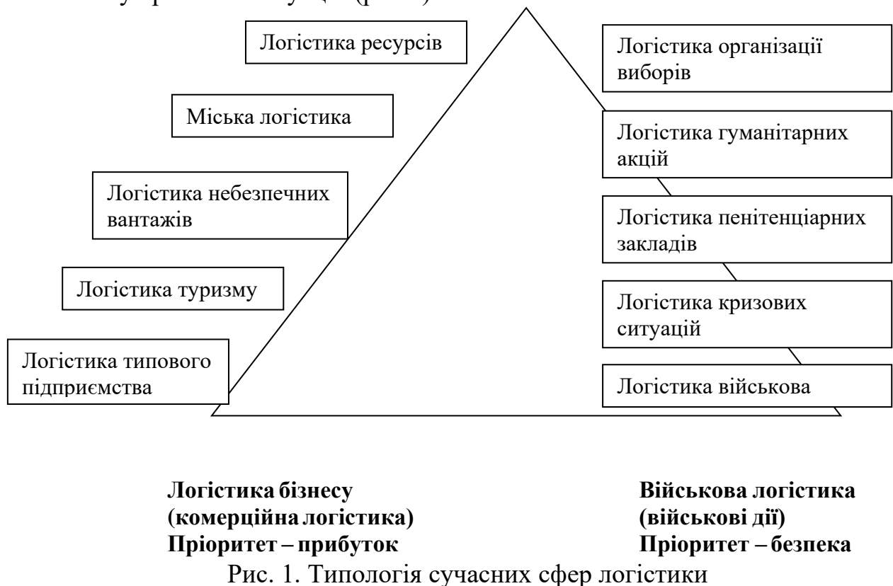
Рис. 1. Типологія сучасних сфер логістики

заходів, логістику туризму, міську логістику, логістику охорони здоров'я, гуманітарну логістику тощо. До цього переліку, за думкою автора, слід додати і логістику кризових ситуацій (рис.1).