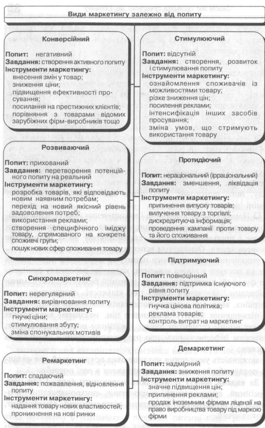
Рис. 2.3. Класифікація маркетингу за попитом і його інструменти

Залежно від сфери застосування розрізняють маркетинг споживчий, промисловий, аграрний, банківський, інвестиційний, інноваційний тощо.