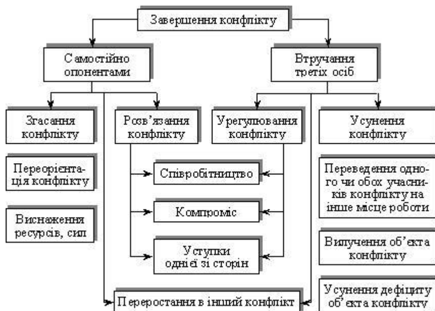
Рис. 3. Основні форми завершення конфлікту

Згасання конфлікту — це тимчасове припинення протидії за збереження основних ознак конфлікту: суперечностей і напружених відносин. Конфлікт переходить із явної форми в приховану. Згасання конфлікту зазвичай відбувається в результаті: виснаження ресурсів обох сторін, необхідних для боротьби; втрати мотиву до боротьби, зниження важливості об'єкта конфлікту; переорієнтації мотивації опонентів (нові проблеми, більш серйозні, ніж боротьба в конфлікті).