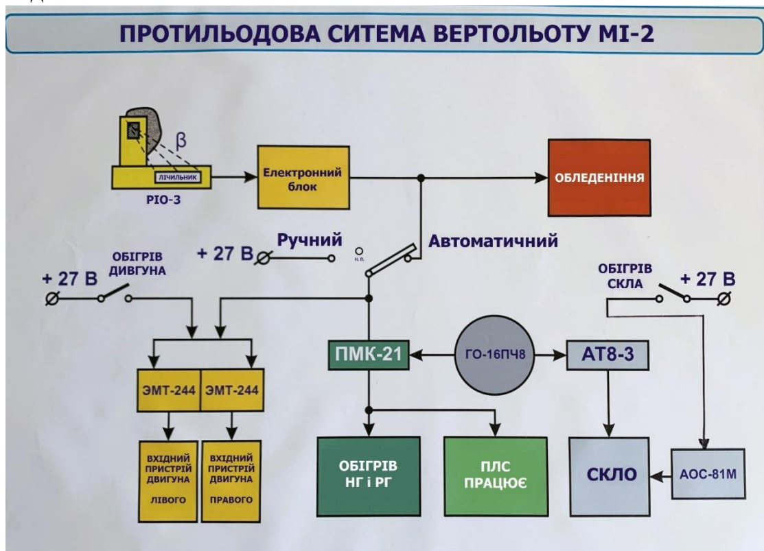
Рисунок - Схема роботи протильодової системи

Для забезпечення безпеки польотів в умовах обмерзання відповідальні і схильні до обмерзання частини вертольота мають протильодові пристрої, до яких відносяться: