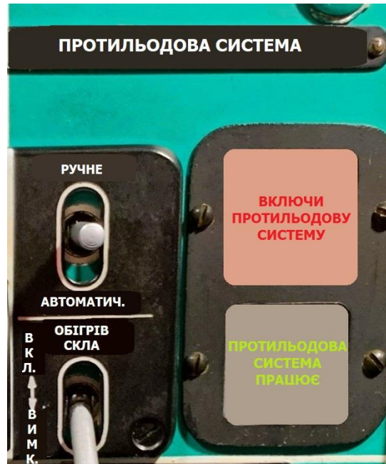
Рисунок - Панель управління протильодовою системою

При установці перемикача в положення «АВТОМАТ» протильодові частини будуть включені автоматично сигналізатором при наявності умов обледеніння.