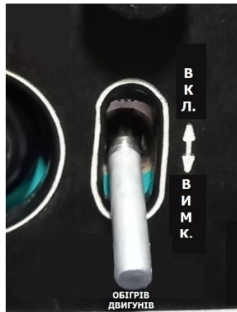
Рисунок - Перемикач включення обігріву двигунів

В системі електротеплового обігріву двигунів працюють два клапана перепуску і протильодового типу з електромагнітом МКТ-4-2. Клапани включаються автоматично, одночасно з системою обігріву лопатей несучого і хвостового гвинтів, за сигналом сигналізатора обмерзання.