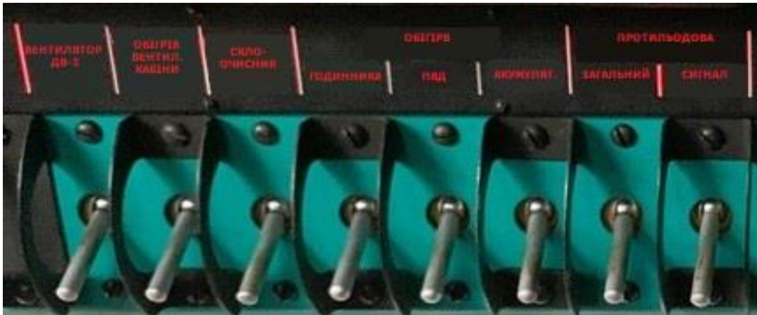
Рисунок - Панель АЗСів протильодової системи