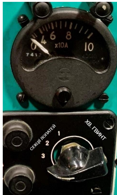
Рисунок - Панель управління обігріву лопатей несучого та хвостового гвинтів

Струм, споживаний першої і другої групами секцій лопатей несучого гвинта, повинен бути від 55 до 65А, а третьою групою секцій від 50 до 60А. Щиток перевірки струму секцій зображено на рис. 2.8 Струм, споживаний нагрівальними елементами хвостового гвинта, від 15 до 20 ампер. Силові контактори встановлені в панелі обігріву.