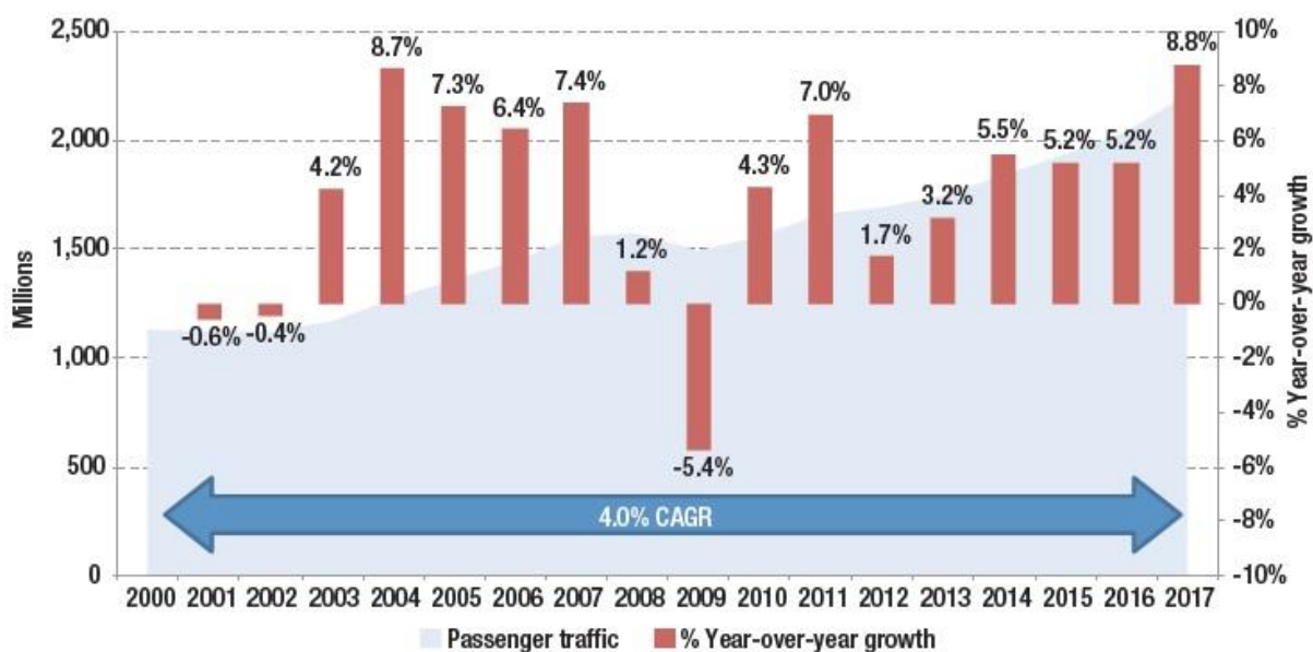
Діаграма 1: Динаміка пасажиропотоку в Європі (2000–2017 рр.)

Європейський авіаційний сектор є однією з найефективніших частин європейської економіки та провідною галуззю у світі. 900 мільйонів авіапасажирів щорічно подорожують до Європейського союзу, з нього та всередині нього, що становить третину світового ринку.