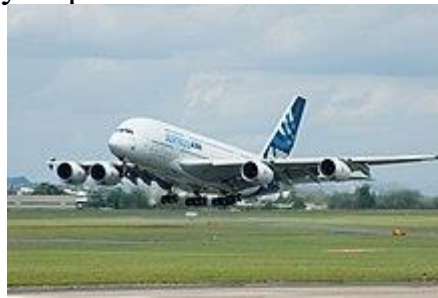
A380 на Paris Air Show 2007

Новітня розробка компанії Airbus — це літак Airbus A350 . Він є результатом глибинної переробки A330 і має на меті конкурувати із Boeing 787 . Та аеробус вже викликає критику експертів авіації, вони вважають його неконкурентоспроможним у порівнянні із машиною Boeing'a.