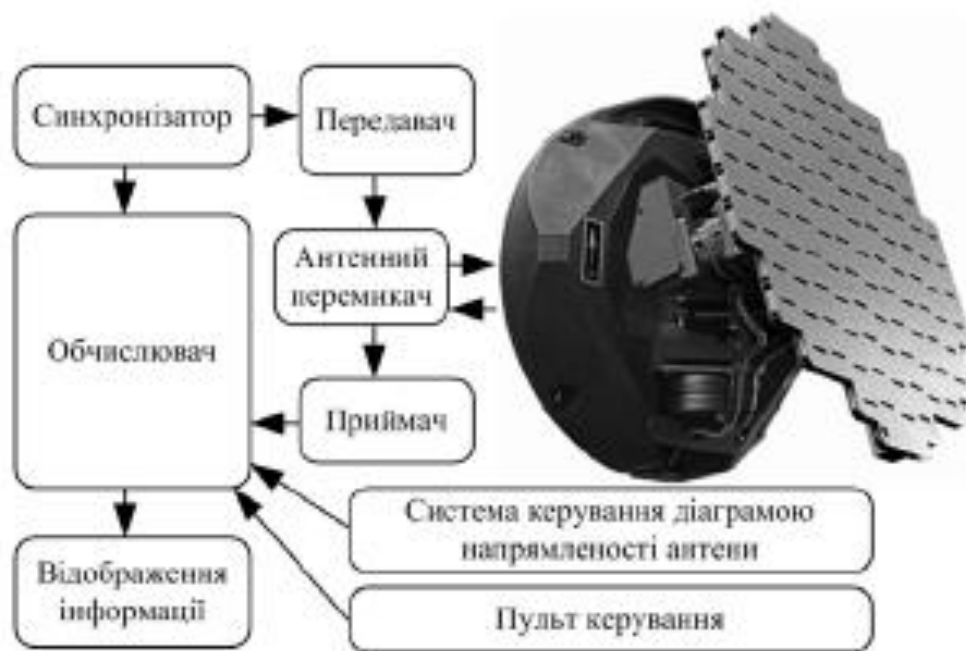
Рисунок 4 – Функціонування метеолокатора

Передавач WR формує радіозондувальний сигнал на частоті 9345 \pm 15 МГц, який через антенний перемикач подається на антенну систему. Антенна система призначена для випромінювання та приймання зондувальних радіолокаційних сигналів. Антена WR установлюється на носовій частині ПК під обтічником, виконаним з радіопрозорого матеріалу.