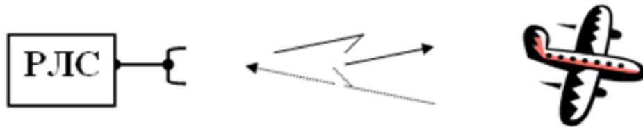
Рисунок 1- Пасивний метод радіолокації

Істотною проблемою при використанні транспондерів режиму А є відсутність інформації про висоту польоту повітряного судна. Для вирішення даної ситуації був створений режим С. Він доповнює інформацію чотиризначного коду даними про барометричної висоти по стандартному тиску без корекції.