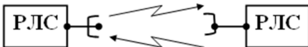
Рисунок 2- Активний метод радіолокації

Цей спосіб передбачає наявність на об'єкті власної РЛС відповідача, який випромінює відповідний сигнал.