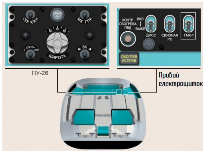
Рисунок 2 – Розміщення ПУ-26 та АЗСГК-5 «ГМК-1» на Мі-8МТВ

Гіроагрегат ГА-6. Гіроагрегат ГА-6 служить для: