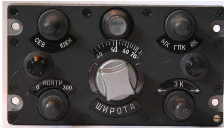
Рисунок 1 – Лицьова панель пульта управління ПУ-26

На лицьовій панелі пульта ПУ-26 розташовані такі органи управління: