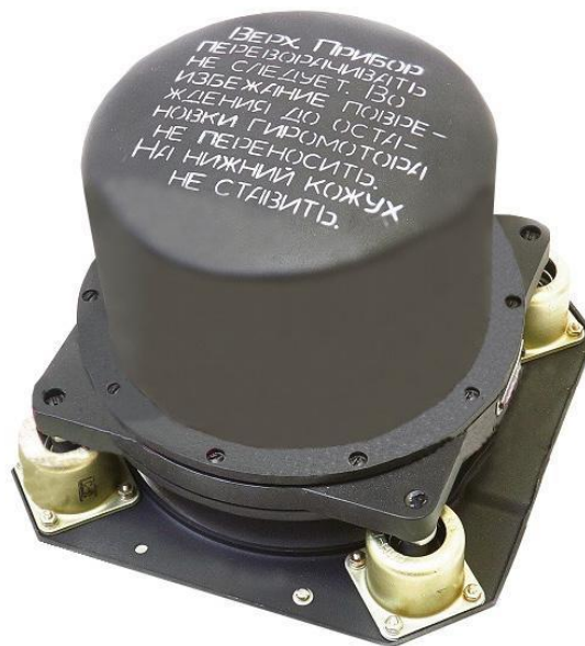
Рисунок 3 – Зовнішній вигляд ГА-6

Зовнішній вигляд гіроагрегату ГА-6 наведений на рисунку 3.