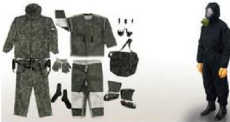
Рис. 2.4. Загальновійськовий фільтрувальний комплект

Загальновійськовий фільтрувальний комплект ЗФК забезпечує високоефективний і надійний захист усіх частин тіла й органів дихання від отруйних речовин, світлових і термічних вражаючих факторів, основних видів хімічно небезпечних речовин. Відмінними рисами нового комплексу є високі фізіолого-гігієнічні властивості, поєднання засобів захисту органів дихання й шкіри з основними елементами екіпірування й озброєння солдата, надійне функціонування за низьких температур, можливість багаторазового використання після зараження й спеціальної обробки. Перебуває на озброєнні військ РХБЗ із кінця 1990-х років (рис. 2.4).