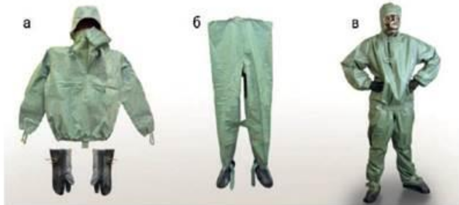
Рис. 2.2. Легкий захисний костюм Л-1: а — сорочка з капюшоном, двопальцеві рукавиці; б — штани з панчохами; в — рятувальник, одягнений в Л-1

Легкий захисний костюм Л-1 (рис. 2.2) виготовляють із прогумованої тканини, і в комплект його входить: куртка з капюшоном; штани, які пошиті разом з панчохами; підшоломник; двопальцеві рукавиці. Окрім того, є сумка для перенесення і запасна пара рукавиць. Його розміри такі ж, як у захисного комбінезона (костюма). Маса комплекту 3 кг. Л-1 використовують у розвідувальних підрозділах воєнізованих формувань ЦЗ.