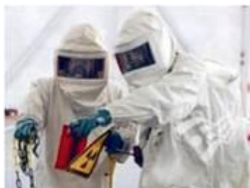
Рис. 2.1. Герметичні індивідуальні засоби захисту

Засоби захисту шкіри. Засоби захисту шкіри призначені для захисту тіла людини в умовах зараження місцевості отруйними, радіоактивними речовинами та біологічними засобами. Їх поділяють на звичайні (найпростіші, підручні) та спеціальні (табельні).