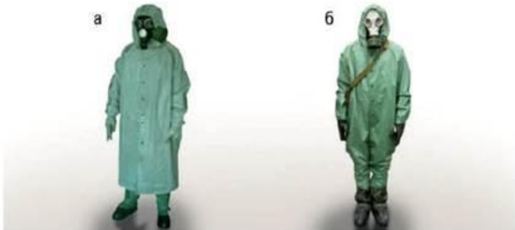
Рис. 2.3. Загальновійськовий захисний комплект (ЗЗК): а — одягнений у рукави; б — у вигляді комбінезона

Загальновійськовий захисний комплект (ЗЗК) (рис. 2.3) складається із плаща з капюшоном (ОП-1), панчіх і рукавиць. Маса комплекту 3 кг. Плащі