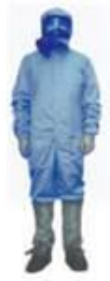
Рис. 2.5. Протичумний костюм «Кварц»

Для захисту органів дихання й шкірних покривів медичного персоналу від біологічних агентів (захист від біологічної зброї, лабораторна діагностика особливо небезпечних інфекцій) призначений протичумний костюм «Кварц», який виготовляють вітчизняні підприємства (рис. 2.5).