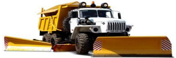
Рис.1 Схеми плужних снігоочисників

а - одновідвальний; б - одновідвальний з крилом; в - двохвідвальний; г - двохвідвальний з крилом