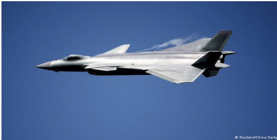
Китайський винищувач J-20

4. Індія займає четверте місце у авіарейтингу (2182 од., 4%)