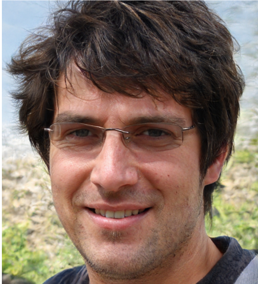
Рис. 2. Зображення обличчя

10. Під час розслідування кримінального провадження за ознаками вчинення злочину, передбаченого ст. 301 Кримінального кодексу України було встановлено, що підозрюваний здійснює відмивання коштів з використанням криптовалют. В одній із транзакцій фігурувала біткоїн-адреса (обрати довільну адресу з сайту моніторингу транзакцій). Візуалізувати рух коштів за наведеною адресою з використанням спеціалізованих сервісів. Підрахувати загальну кількість отриманих та надісланих на неї біткоїнів.