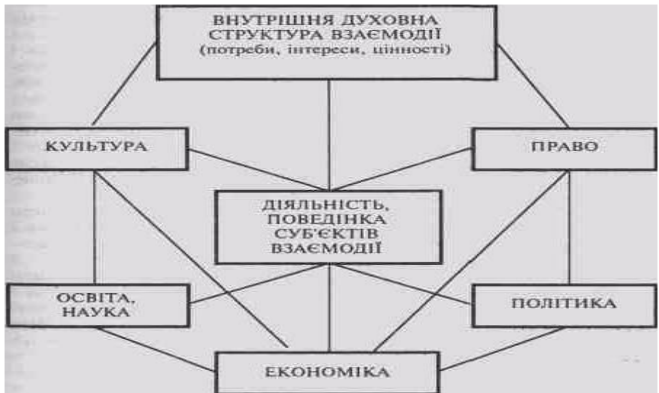
Мал. 3. Механізм соціальної взаємодії.

Можна схематично зобразити предмет соціології через багатство зв'язків, механізмів, які вона вивчає (Запропонуйте свій варіант малюнка).