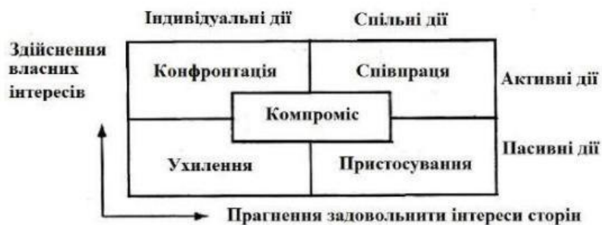
Рис. 1. Стили поведінки людини в конфліктних ситуаціях

Так, наприклад, встановлено, що всі види вирішення конфліктів між людьми зводяться до 5 способів і визначаються 4 видами дій учасників, що відображено на сітці Томаса-Кілмана (рис. 1).