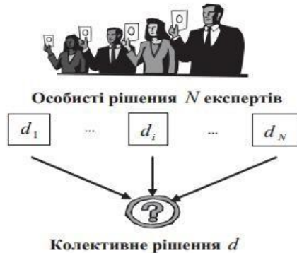
Рис. 1. Схема формування колективного рішення

Нехай експерти A_1, \dots, A_N , N \geq 2 , братимуть участь у колективному прийнятті рішень. Припустимо, що група розглядає деякий набір альтернатив, і кожний i -й член групи здійснює свій вибір d_i . Виникає задача формування колективного рішення \square d , що певним чином узгоджує індивідуальні рішення та виражає «загальну думку» групи (рис. 1).