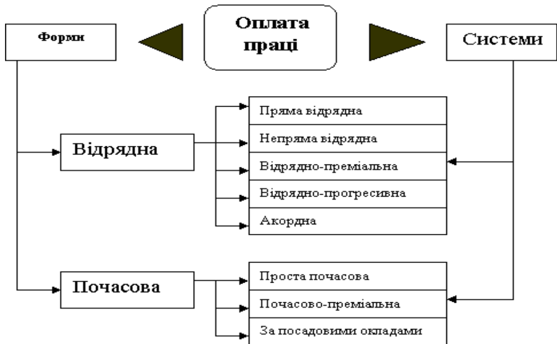
Рис. 2 – Форми і системи оплати праці

Залежно від того, що є основою визначення розміру заробітку – обсяг виконаної роботи (продукції) чи відпрацьований час, виділяють дві основні форми заробітної плати: відрядну й погодинну.