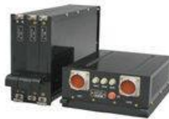
Комплекс АЗН-В (S)

АЗН є однією зі складових концепції ICAO розвитку системи організації повітряного руху CNS / ATM.