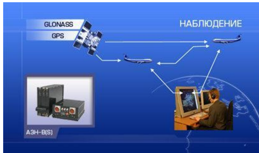
Автоматичне залежне спостереження (АЗН)

споживачеві (наземному або бортовому) інформацію про своїх координатах, параметри руху і найближчих намірах (наступному пункті маршруту і заданій висоті).